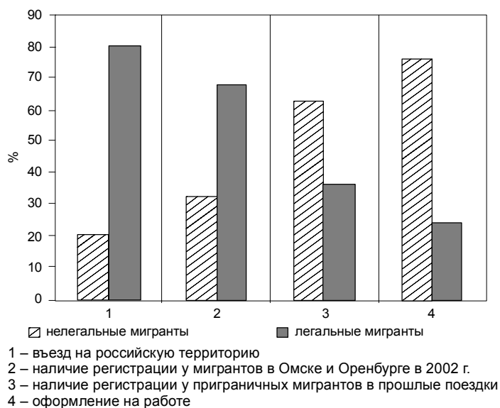
Рис. 4.1. Соотношение легальных и нелегальных мигрантов (%)

На рисунке 4.1 сведены воедино результаты опросов по двум анкетам, касающиеся соотношения легальных и нелегальных мигрантов с точки зрения различных сторон их жизни в России (легального и нелегального въезда, наличия регистрации, легальной и нелегальной занятости).